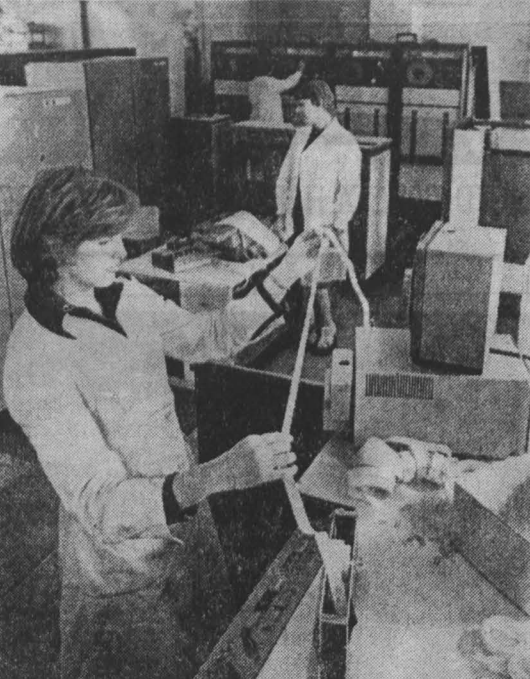
Каждое письмо, направленное в редакцию газеты «Кузбасс», тщательно готовят для его обработки на электронно-вычислительной машине. С этой целью корреспондент отдела писем, пользуясь разработанным методом, квалифицирует письмо и все необходимые данные заносит на специальный конверт. Затем оператор отдела на основании этих данных заполняет на письмо своего рода визитную карточку и все интересные редакции данные с помощью телеайпа заносит на перфолену.