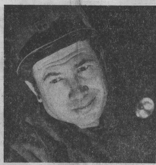
Участок № 2 шахты «Шерегешская» — монтажный. Он занимается монтажом ВДПУ-4ТМ, настала грохта, бурит штанговые сванкины в горизонтах подсечки. От качества работы этого коллектива и сроков ввода в действие «Сибирички» во многом зависит выполнение плана добычного участка, трудовой ритм всей технологической цепочки добычи металлургического сырья. И монтажники четко себе это представляют, а потому ведут борьбу за успешное и качественное выполнение всех объемов работ.

Областной комитет партии, областной штаб выражают твердую уверенность в том, что кузбассовцы все как один завтра примут участие в коммунистическом субботнике. По поручению бюро обкома КПСС хотелось бы пожелать всем участникам ленинского субботника высокопроизводительного труда, хорошего рабочего настроения.