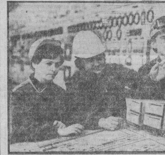
Рабочая честь, долг, совесть