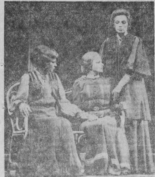
ВЕНГРИЯ. В будапештском театре имени Мадача с успехом идет недавно поставленный спектакль по пьесе А. П. Чехова «Три сестры». Реликвизор О. Адам.

Один из опытных образцов нового электромобиля уже работает в Софийском аэропорту. В скором времени первые две тысячи электромобилей начнут курсировать по улицам столицы НРБ — на них в основном будут по ночам бесшумно доставлять в магазины продукты. Грузоподъемность электромобиля — две с половиной тонны. (София-пресс — АПН).