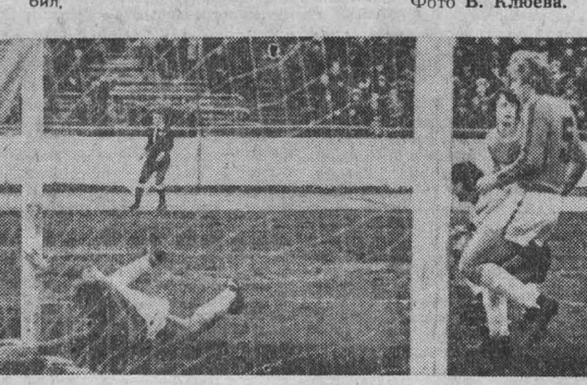
НА СНИМКАХ: мяч в воротах.

После перерыва гости попытались отыграться. Удалось это им частично, когда А. Довбый пробил в сторону ворот, и мяч, скривившись от В. Толчеева, неожиданно попал в цель.