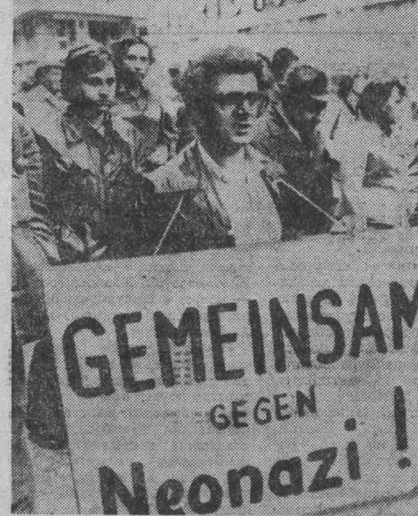
НА СНИМКЕ: участники манифестаций.

▲ Неделя борьбы против фашизма и неонацизма прошла в столице Австрии. Участники митингов и манифестаций, организованных в рамках недели, разоблачали кровавые преступления гитлеровцев в годы второй мировой войны, требовали остановить возрождение нацизма, запретить неонацистские организации. НА СНИМКЕ: участники манифестаций.