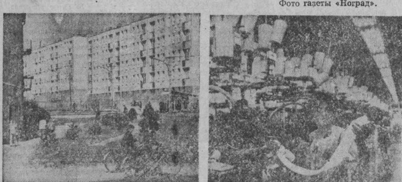
НА СНИМКАХ: в новом районе Шалготарьяна; на чулочной фабрике; «Расти здоровым!» — медсестра детского отделения больницы Шалготарьяна с маленьким пациентом.