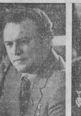
Г. СМЕРНОВ: Чтобы увеличить поток топлива, в Кузбассе надо строить новые угольные предприятия.