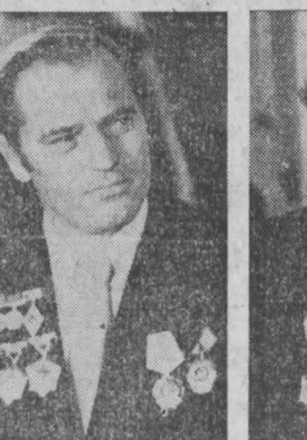
В. СОЛОВЬЕВ: Коллектив может многое.