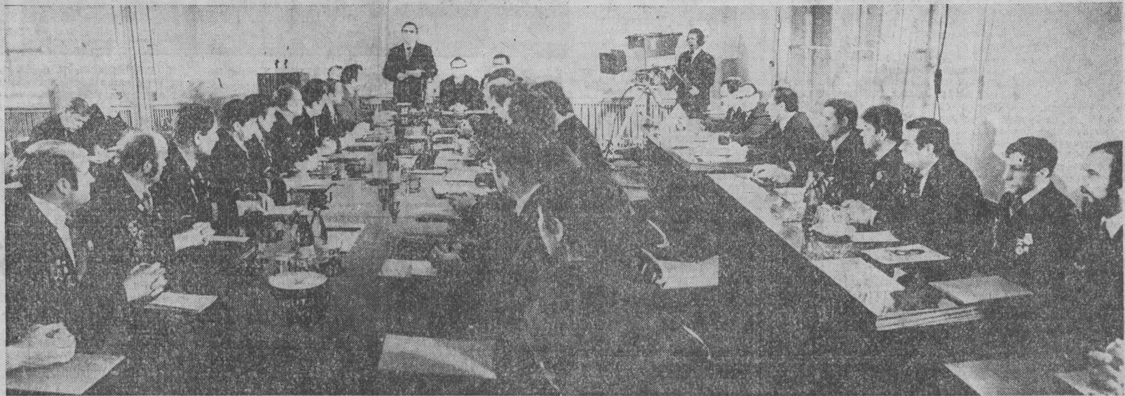
НА СНИМКЕ: встреча передовых бригадиров.

Редакции областных, городских и многотиражных газет, областной комитет по телевидению и радиовещанию обязаны систематически освещать итоги социалистического соревнования трудящихся области за досрочное выполнение заданий 1980 года и пятилетки в целом, широко пропагандировать достижения передовиков и новаторов производства, обобщать и показывать опыт коллективов, добившихся наивысших показателей в работе.