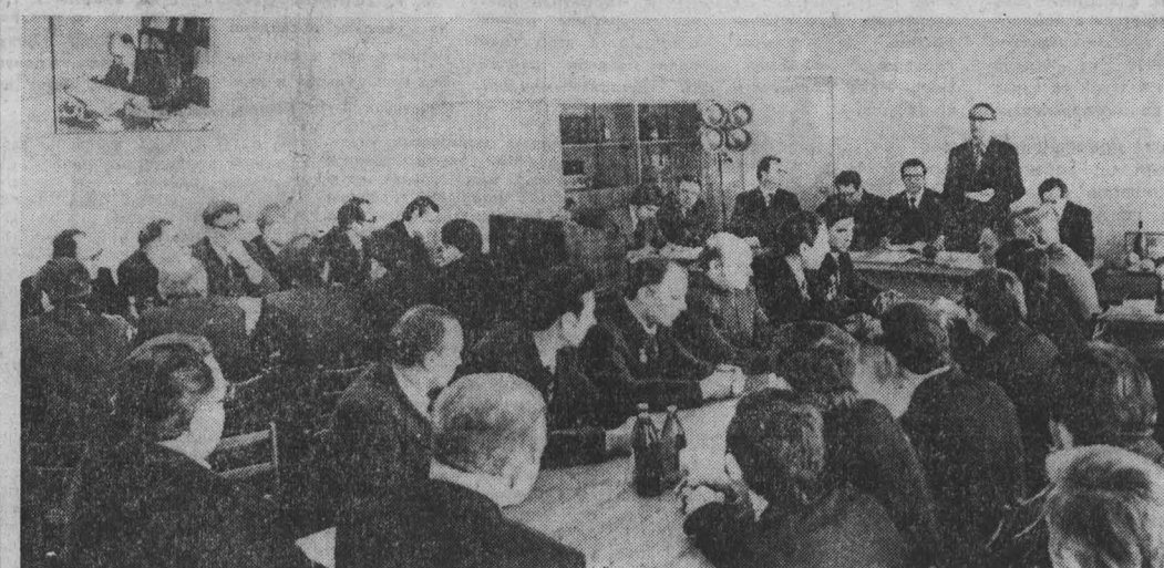
НА СНИМКЕ: участники беседы за круглым столом «Кузбасса».