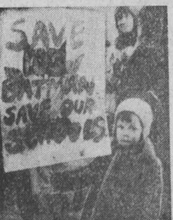
«Спасите наши школы!» — гласит лозунг в руках маленького англичанина, который вместе с родителями принял участие в демонстрации протеста против сокращения государственных ассигнований на образование.