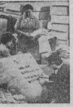
Страны социализма поддерживают борьбу кампучийского народа за построение новой Кампучии.