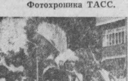
Во время праздника в Эфиопии.