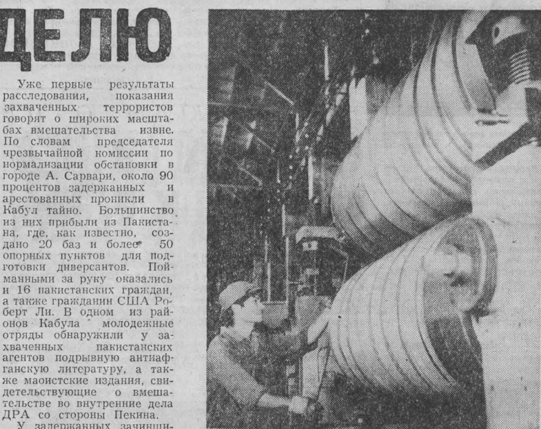
СОЦИАЛИСТИЧЕСКАЯ РЕСПУБЛИКА ВЬЕТНАМ. Машиностроение и металлургия — быстро развивающиеся отрасли народного хозяйства Вьетнама...