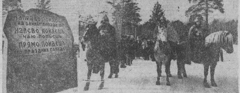
Первыми встретили участников Дней культуры три «богатыря».