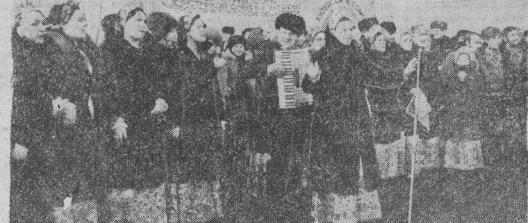
Гостей приветствуют участники художественной самодеятельности.

Адрес редакции и издательства: 650630, ГСП, г. Кемерово-99, ул. Ноградская, 3. Телефоны: приемной редактора 6-69-74, заместителя редактора 6-65-74, ответственного секретаря 6-68-81, зам. ответственного секретаря 6-65-63, отделов редакции: партийной жизни 6-61-83 и 6-02-08, пропаганды 6-66-73, 6-44-22, Советов народных депутатов 6-64-84, тяжелой индустрии 6-69-44, химической и легкой промышленности 6-65-86, 6-38-49, сельского хозяйства 6-67-82 и 6-90-71, культуры 6-62-01, 6-47-44, строительного 6-67-46 и 6-02-09, писем и рабальщиков 6-90-52, 6-78-97, 6-87-68, 6-60-72, информации и спорта 6-82-61, 9-58-76, 6-62-37, еженедельника «Панорама» 6-63-02, объявлений 6-68-72, фотокорреспондентов 6-90-63, приема информации 6-88-85, общественной приемной 6-66-52, бухгалтерии 6-89-53, директора издательства 6-69-23. Собственные корреспонденты: в Новокузнецке — 7-02-04, Прокопьевске — 2-17-34, Междуреченске — 2-33-04, Юрге — 2-06-09, Мариинске — 31-20.