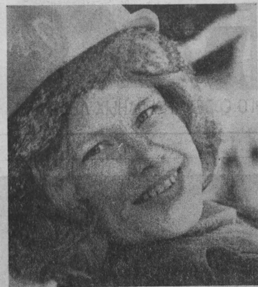
Человек и его дело НА СВОЕМ МЕСТЕ