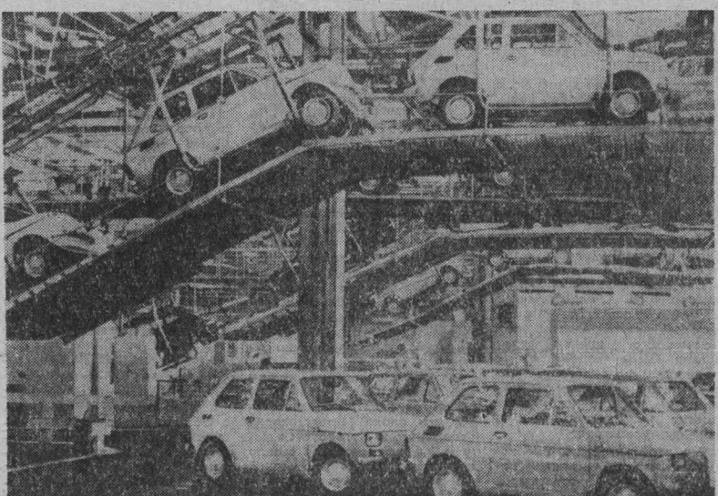
Польская народная республика. За годы социалистического строительства польская автомобильная промышленность стала высокоразвитой, передовой в техническом отношении отрасли. Ее продукция пользуется доброй славой не только внутри страны, но и далеко за ее пределами. Быстро растут производственные мощности автозавода в городе Бельско-Бяла, где выпускают микроавтобусы «Финат-126 П». Принято решение о дальнейшем расширении и модернизации предприятия, выпускающего эти популярные в Польше и за границей автомобили. НА СНИМКЕ: в сборочном цехе.

НЬУ-ЙОРК, 18 февраля. (ТАСС). МИД Ирана направил генеральному секретарю ООН ноту с резким протестом против незаконных действий Канады, организовавшей нелегальный выезд из Ирана шести американцев. Как известно, эта операция, проведенная по прямому указанию премьер-министра Канады Кларка и президента США Картера, включала выдачу американцам фальшивых канадских паспортов и подделку официальных иранских виз.