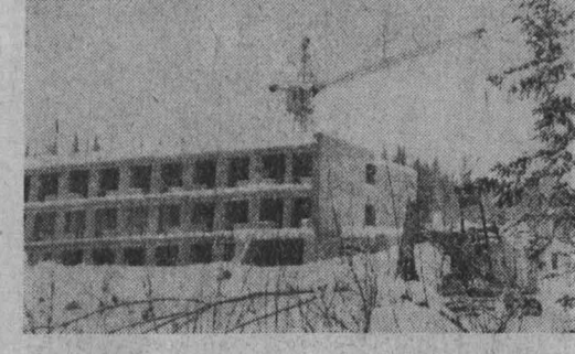
НА СНИМКАХ: Г. Н. Быкова; на строительной площадке профилатория.