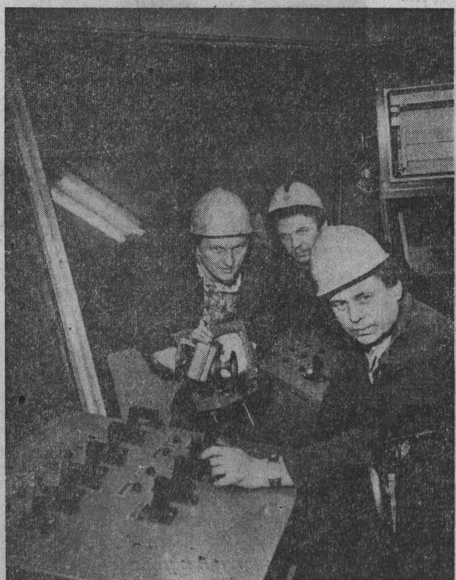
Проектные мощности — досрочно!