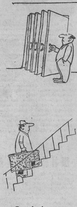
Рис. А. Алешичева.