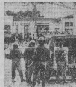
В центре города, неподалеку от шумных и пестрых, всегда кипевших жизнью торговых районов, расположено афганское информационное агентство Бакхар.

Валганте: из разных провинций и городов Афганистана потоком поступают материалы о том, что широкие массы населения, коллективы предприятий, крестьяне, ремесленники, воинские части активно поддерживают программу нового правительства. Во многих телеграммах подчеркивается, что