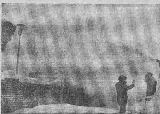
Вам инициация зима кажется холодной? Вы замерзли? Тогда приглашаем вас на улицу Станционную и прачечной № 5 банно-прачечного треста управления коммунального хозяйства Кемеровского горисполкома. Мощная струя пара день и ночь бьет из выведенной на улицу трубы. Видимо, «рационализаторы» в банно-прачечном предприятии забыли благородную цель: довести наш резкий континентальный климат до субтропического. Перерасход теплоэнергии при этом сушая мелочью.

это новейшее достижение рекламы треста «Электросибмонтаж». А как обстоят дела на строительной площадке жилого дома по ул. Садовой (где тоже работает вышеупомянутый трест)? При фальши центральное водное отопление здесь применяют электрокалориферы и электронагревательные печи мощностью 37 квт, а для отопления вагончиков — 36 квт. Нерациональный расход электроэнергии составляет 70 тыс. квт-час в год. Начальник строительного участка Г. К. Вершинин поясняет, что это расточительство, но изменить установившуюся традицию не пытается. Не отстает от него в этом «соревновании» главный механик гаража монтажного управления № 7 этого же треста В. И. Распутин. Здесь также при наличии центрального отопления в гараже и вагончиках электрическую энергию исподвудуют на полную катушку. В результате на ветер выброшено 23 тысячи квт-час. Аналогичная картина и в бытовых помещениях участков № 1 и 2 строительного управления № 2 треста «Кемеровострой», где механиком управления работает Н. М. Кошкин. Кемеровчанам известно здание завода по ремонту бытовых машин и приборов производственного объединения «Кузбассрембытехника». Его просторные четыре этажа светятся не только в рабочее время, но и после него. В течение обеденного часа ни один светильник не выключается. И в цехе ремонта часов при отсутствии на рабочих местах мастеров не принято выключать местное освещение. В эти солнечные дни борьба между директором завода И. Я. Спирининым и небесным светилом закончилась победой последнего.