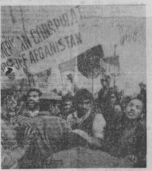
Массовые демонстрации индийской общественности состоялись в Дели. МанIFESTАНТЫ решительно осудили попытки Индия и США грубо вмешаться во внутренние дела Афганистана.