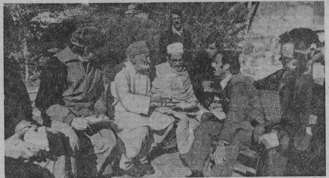
Полная поддержка нового руководства ДРА и выдвинутой им обширной, подлинно революционной программы...