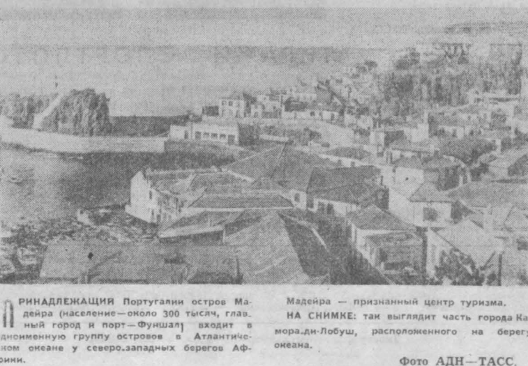
МАДЕЙРА — ПРИЗНАННЫЙ ЦЕНТР ТУРИЗМА. НА НИММКЕ: так выглядит часть города Ка-морради-Лобуш, расположенного на берегу океана.

МАРИАННЫЕ ПЕРСПЕКТИВЫ в области экономической политики ФРГ вырисовываются на 1981 год. Безработица, инфляция, промышленный спад, предсказываемые ведущими экономистами и официальными Бонном, свидетельствуют о том, что ФРГ, как и ее партнеры по «общему рынку», вступает в полосу очередного кризиса. Согласно оценкам федерального правительства, в будущем году армия западногерманских безработных превысит 1,1 миллиона человек. «Кандидаты» уже сегодня могут быть названы рабочие концерна «Хёль» — одного из крупнейших в металлургической промышленности страны. Реальная угроза быть выброшенными на улицу, наивысшая над сталеварами Рура, сплавляет их на решительную борьбу против произвола хозяев, в защиту права на труд. НА НИММКЕ: металлурги во время массовой манифестации в Дортмунде.