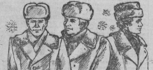
Для вас, мужчины! КЕМЕРОВСКАЯ ОБЛАСТНАЯ ВАЗА РОСТОРГОДЕЖДА ПРЕДЛАГАЕТ

Новая цветная кинокомедия ЗА СПИЧКАМИ (13, 14, 16, 18, 20, 21-50). Малый зал. Тоска по родине (14, 16, 18, 19-50, 21-40) — детям смотреть не рекомендуется. ПЕРВОКЛАССНИЦА (10, 12 — для детей). «ШУБЛЕНЫЙ». ФРАК ДЛЯ ШАПОЛАЯ (10). Новая цветная кинокомедия ЗА СПИЧКАМИ (11-30, 14, 16, 18, 20, 21-50). «ПОНЕВ». Фильм-сказка КАК ПРОВУЖДАЮТСЯ ПРИНЦЕССЫ (10, 11-40, 13-30, 15-20). АЗЫБАКА (17-10, 19-10, 21). «ОКТАВЬЯ». КОТЕЛОК И ВОС КАРТОНКА (15). В ПЛЕЧУ ДВОРЦОВЫХ ИНТРИГ. две серии (12, 17, 20). «МЕТАЛЛУРГ». ОТЯД ТРУВА ЧЕБА СРАЖАЕТСЯ (14). ВЕРБЕ ЗАМУЖЕМ (16, 18, 20). «ПРОГРЕС». ПОЛЕТ С КОСМОНАВТОМ (10, 11-30, 14, 16, 17-50, 19-30, 21-50). «ЛУЧ». ЧУЖАЯ КОМПАНИЯ (13). ПЕРВЫЕ ЗАМУЖЕМ (15). ФИЛАРМОНΙΑ. Большой зал. Неограниченные представления «ВОШЕВНОЕ ОЗЕРО» (феерическая сказка). Начало в 10, 13, 16 и 19 час. Начало вечерних новогодних представлений ПЕРЕНЕСИТСЯ с 20 час. 30 мин. на 19 час. ДОМ КИНО «МОСКВА». Большой зал. Музыкальная кинокомедия НЕУДАЧНИКИ (10).