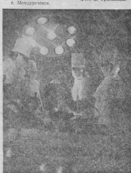
Клуб деловых встреч

Новосибирский институт «Сибгипрошахт» отправил заказчику — объединению «Проктольскуголь» технический проект вскрытия и подготовки нового горизонта на одной из старейших шахт рудника — имени Дзержинского.