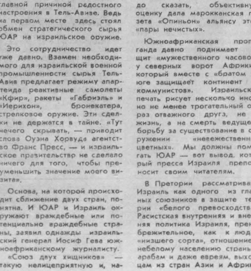
Южноафриканская пропаганда давно поднимает на щит «мукашенистского» часовой у северных ворот Африки...