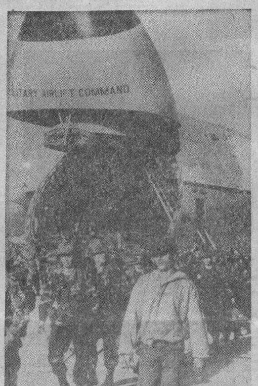
НА СНИМКЕ: прибытие группы американских военных.

ВАРШАВА, 27. (ТАСС). Журнал ЦК ПОРП «Идеология и политика» обращает внимание на активизацию антикоммунистических сил в Польше, которые усиливают нападки на ПОРП и социалистические завоевания трудящихся.