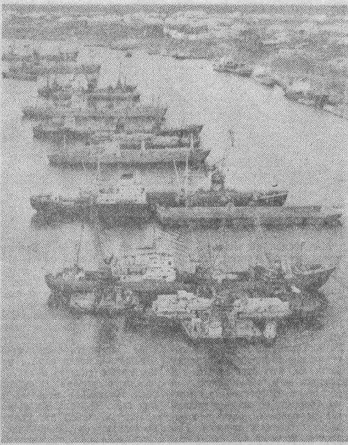
КРАСНОЯРСКИЙ КРАЙ. Игарка — крупный лесной порт на Енисее. Самые большие кубометры высококачественных пиломатериалов, изготовленных на предприятиях производственного объединения «Красноярсклесозащита», грузят ежегодно портовыми на суда, следующие Северным морским путем в различные страны.

Л. КОРЕНЕВ, экономический обозреватель АПН.