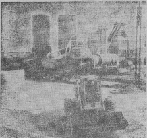
По законам сотрудничества

Реализация целей социалистической экономической интеграции обеспечивает выгоды для всех стран — членов СЭВ. Это влияет, в частности, на ускорение научно-технического прогресса и модернизацию хозяйства.