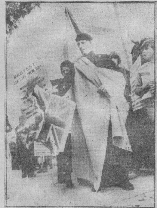
О ПРИЗЫВЕ прогрессивной английской организации «Движение за предоставление прав человека политическим заключенным в Северной Ирландии» в Лондоне прошло двойное пикетирование...