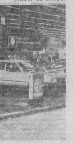
Советский Союз был представлен машина, «Лада» и «Нива», уже завоевавшими популярность во многих странах.

НЬЮ-ЙОРК. Торжественным вечером в штаб-квартире ООН, организованной по инициативе «Клуба русской кини», сенатората ООН, началось проведение дней Советского Союза в Нью-Йорке. Эти дни, серия мероприятий в рамках которых уже состоялась в Вашингтоне и Филадельфии, проходит в связи с 63-й годовщиной Великой Октябрьской социалистической революции и с 47-й годовщиной установления дипломатических отношений между СССР и США.