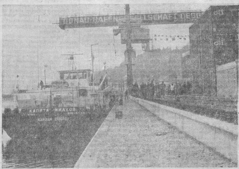
ФРГ. Современный речной порт введен в строй в небольшом западногерманском городе Деггендорф на Дунае.

Выступая после завершения переговоров перед журналистами, В. Жискара д'Эстан и Г. Шмидт констатировали совпадение позиций двух стран практически по всем обсуждавшимся вопросам, к которым наблюдатели относят прежде всего отношения между Востоком и Западом, ориентацию на разрядку и международное сотрудничество, положение в НАТО, поиски путей, ведущих к сокращению вооружений и др.