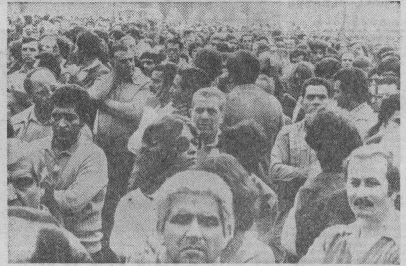
Длительная борьба рабочих автомобильно-строительного концерна ФИАТ в Турине (на снимке) вынудила администрацию пойти на уступки требованиям трудящихся. В частности, компания отказалась от планов массовых увольнений.