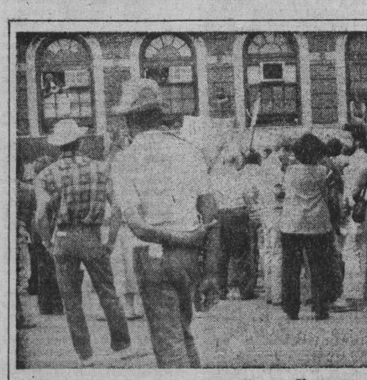
США. Уже который год подрыв власти Нью-Йорка пытаются найти выход из финансового тупика, в котором оказался город, за счет сокращения бюджетных ассигнований на здравоохранение, образование, жилищное строительство, помощь престарелым.

Хельсинки не распахнуло все ворота в Европе настуже и, напротив, еще больше вооружило привратников. Но оно скромно умалчивает о заслугах собственного правительства в подрыве международного взаимопонимания.