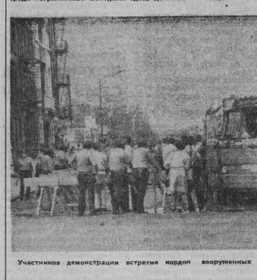
Участников демонстрации встречи кордон вооруженных полицейских.