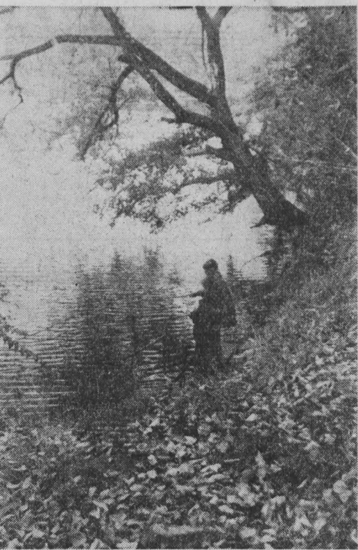
наш фото клуб