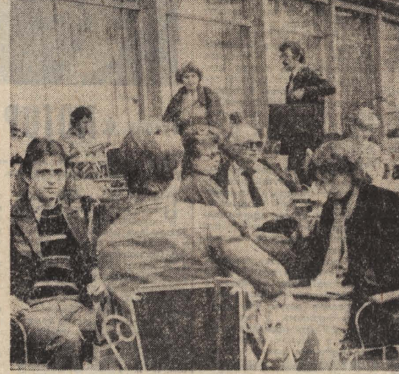
СТОЛИЦА ГДР социалистический Берлин — это город современных новостроек и тщательно реставрируемых памятников старины, широких проспектов и просторных площадей. Город светлый, зеленый, красивый — любимый жителями, остающийся незабываемым впечатлением у гостей.