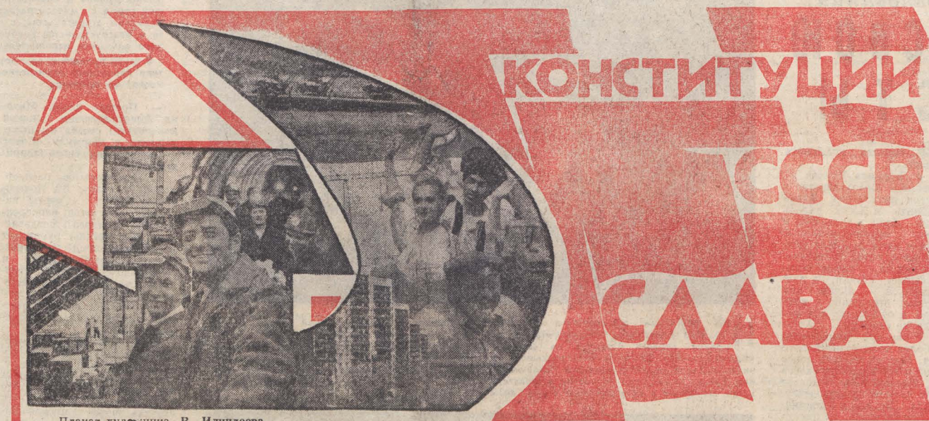
Плакат художника В. Илландова.

Теперь приходится и мне пристально следить за тем, как продвигается дело. В прошлом году побывал на научной конференции, посвященной повышению эффективности угольного производства на шахтах объединения «Прокопьевскуголь». И хотя незнаком еще очень много, убедился: наступление на ручной труд начнется. Доказа-