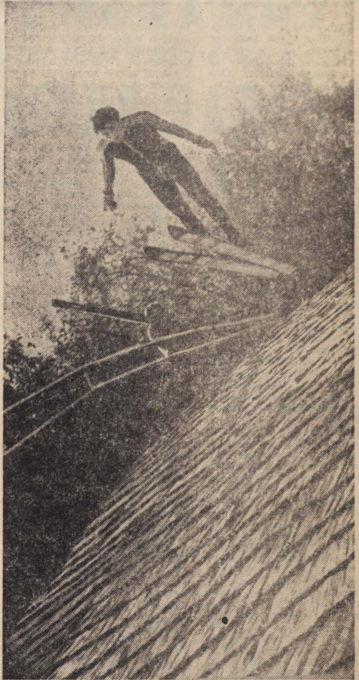
НА СНИМКАХ: в полете кандидат в сборную области для участия в стартах VII зимней Спартакиады народов РСФСР...