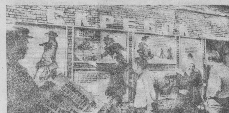
Хороших результатов добивается в нынешнем году коллектив Новокузнецкого алюминиевого завода. Сверхплановые тонны металла, экономия электроэнергии... И немалую долю в эти успехи вкладывают народные контролеры. На заводе создано 49 групп и 15 постов народного контроля, объединивших в своих рядах около 300 человек.

г. Кемерово — Березовский — Анжеро-Судженск.