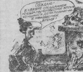
Рис. В. Илинцева.

ТОННО-КИЛОМЕТРЫ — вещь довольно абстрактная. Но в эти сентябрьские дни показателем статистичности наполнен самым конкретным содержанием. Большинство шоферов, работающих на уборочной, хорошо понимают, что сегодняшний тонно-километр — это полное загромождение на всю зиму, этой буханки к обеду, сытной зимовки скота, это завтрашнее молоко и мясо.