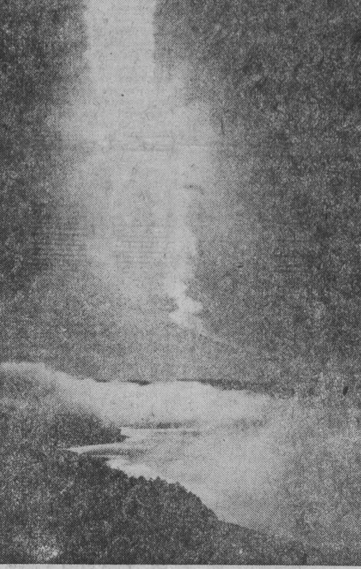
Снимки с персональной выставки: «Бородатая неясность»; «Рождение дня», г. Кемерово.