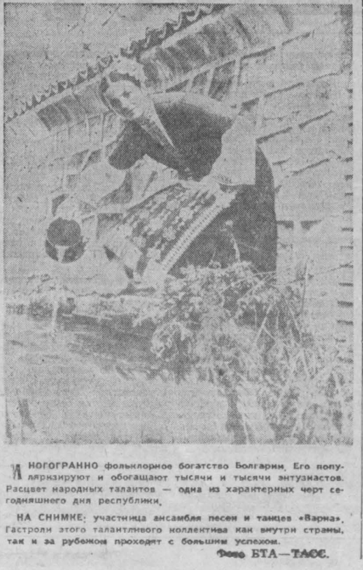
ИНОГРОМНО фальшивое богатство Болгарии. Его полуприкрыто и обогащают тысячи и тысячи антастуны...