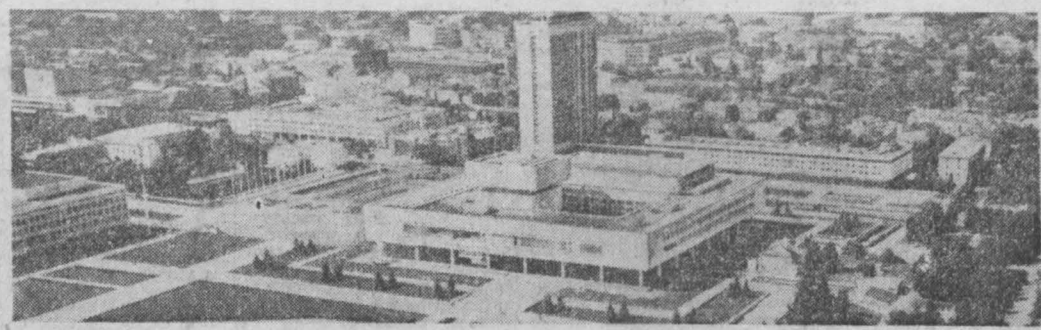
К 110-летию со дня рождения В. И. Ленина.