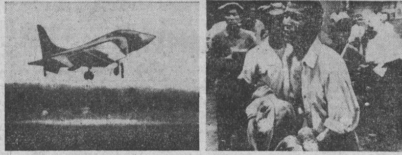
Кадры из фильма «Слово о недобром юбилее».

Используя кадры кинохроники, авторы фильма показывают борьбу натовских заправил против собственных народов, показывают, как они наращивали гонку вооружений, которая поглотила два триллиона 600 миллиардов долларов. Кинокадры свидетельствуют, что сегодня