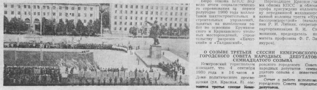
г. Кемерово.

Отчет о работе исполкома городского Совета народных депутатов.