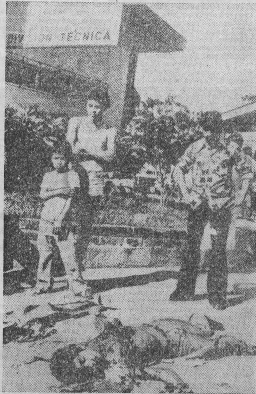
КАРАТЕЛЬНЫЕ органы правящей в Сальвадоре хунты — реакционная военщина и ультраправые военизированные формирования усиливают террор и репрессии против демократических и патриотических сил страны, требующих восстановления демократических прав и свобод, прекращения расправ и насилия. НА СНИМКЕ: одна из жертв реакции.

Это первое публичное признание зловещей роли Вашингтона в трагедии, переживаемой сальвадорским народом, расценивается иностранными наблюдателями как подтверждение не только открытого вмешательства Соединенных Штатов, но и усиления поддержки Пентагоном военно-гражданской хунты.