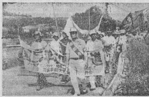
ЯПОНИЯ. Участники общенационального марша мира, посвященного 35-летию годовщины ядерной бомбардировки американской авиацией японских городов Хиросима и Нагасаки...