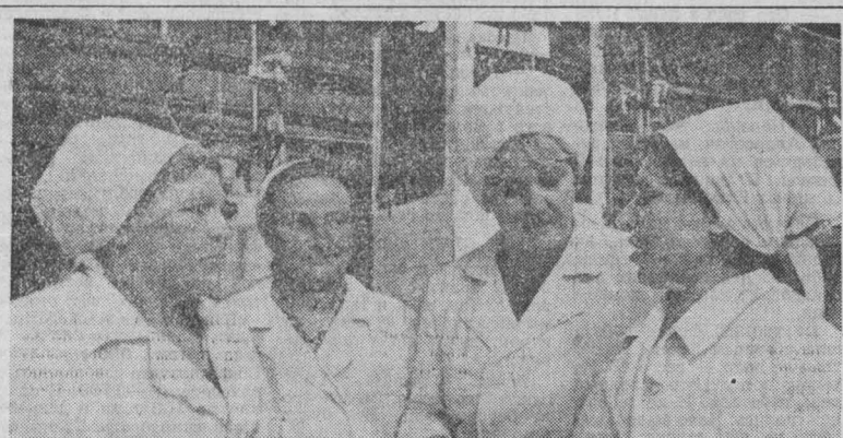
Коллективу Мысковского молочного завода во Всесоюзном социалистическом соревновании неоднократно присваивали классные места. Ежедневно в ассортименте предприятия молоко, сметана, творог, кефир, йогурт, масло. Потребители этой продукции — города Мыски, Междуреченск и Орджоникидзе.