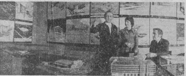
Крупные производственные комплексы, объекты теплоснабжения, общественные здания и спортивные сооружения проектирует институт «Латгипропром».