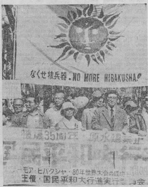
Я ПОНЯИ. «Уничтожить атомное оружие»... требуют участники марша мира...