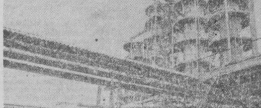
На снимке: на газовом месторождении Джарнудак, откуда газ поступает по нефте- проводу в Советский Союз.