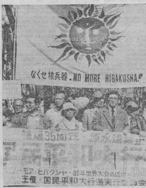
Япония. «Уничтожить атомное оружие». «Не допустить новых жертв атомной бомбардировки» — требуют участ- ники марша мира, посвященного 35-й годовщине варшавской бомбардировки американской авиацией городов Хиросима и Нагасаки.

ЛОНДОН, 10. (ТАСС). Великобритания продолжает рас- ширять сотрудничество с Китаем в сфере вооружений. Ста- ло известно, что на днях кон- церн «Маркони авионикс» заклю- чил крупный контракт на поставку в КНР электронного оборудования. Хотя детали этой сделки, стоимость которой оценивается более чем в 40 млн. фунтов стерлингов, пока хранятся в секрете, однако, отмечает газета «Фай- нэншл таймс», можно с уве- ренностью предположить, что оборудование будет исполь- зовано в военных целях, в ча-