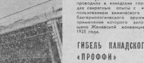
На снимке: на газовом месторождении Джарнудак, откуда газ поступает по нефте- проводу в Советский Союз.