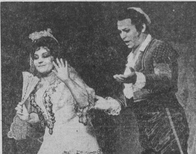
НА СНИМКЕ: народная артистка РСФСР Г. Олейничено и народный артист СССР Ю. Мауэр, в сцене из оперы Россини «Севильский цирюльник».

И. ПОВАЛЯЕВА. НА СНИМКЕ: народный артист СССР А. Огневцев.