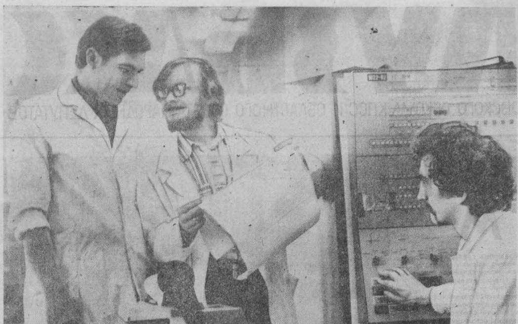
Совершенствуется процесс обучения студентов в КузПИ. Здесь вводится в действие новое поколение ЭВМ ЕС 1022, которое в 1,5-2 раза ускоряет процесс обработки информации и повышает студентам продолжит учебу на качественном новом оборудовании.