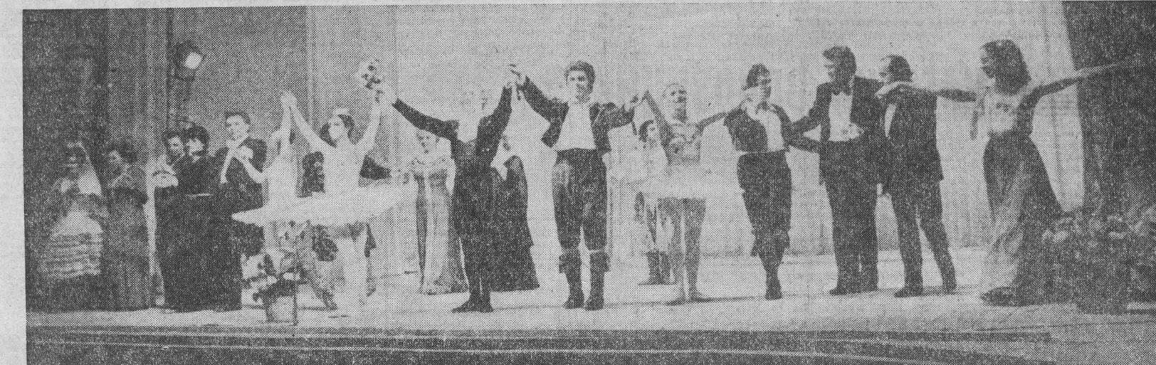
НА СНИМКЕ: финал концерта-открытия.