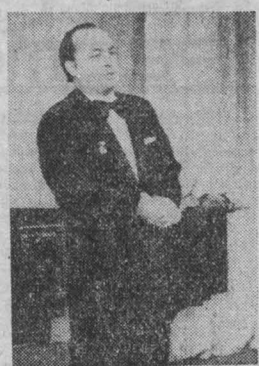
НА СНИМКЕ: народный артист РСФСР, лауреат Государственной премии РСФСР А. Масленников.