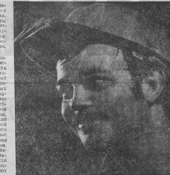
Сталелавильщики первого мартеновского цеха Кузнецкого металлургического комбината им. В. И. Ленина с начала года выдали сверх плана 15 тысяч тонн стали и значительно перевыполнили социалистические обязательства.