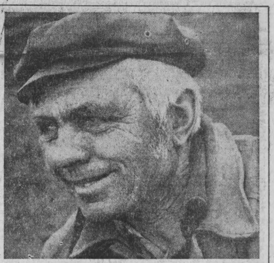
Колхоз имени Димитрова заканчивает посевную. Короткие перемены бывают у механизаторов лишь во время перемены и обеда. И тогда и димитровцам приехала агитбригада Дворца культуры и техники кузнецких металлургов, выступления пришлось прерывать на обедный перерыв. Агитбригадовский «газетчик» так и следовал за машиной, развозящей обеды.

Обработку паров необходимо закончить до 10 июня.