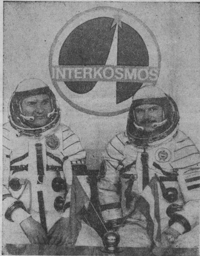
Международный экипаж космического корабля «Союз-36» — командир корабля, дважды Герой Советского Союза, летчик-космонавт СССР В. Н. Кубасов (слева) и космонавт-исследователь, гражданин ВНР Б. Фаркаш.

Совещание открыл выступивший с речью А. П. Кирилленко. С докладом о мерах по обеспечению выполнения в 1980 году плана строительства и монтажа работ, ввода в действие новых энергетических мощностей и об основ-