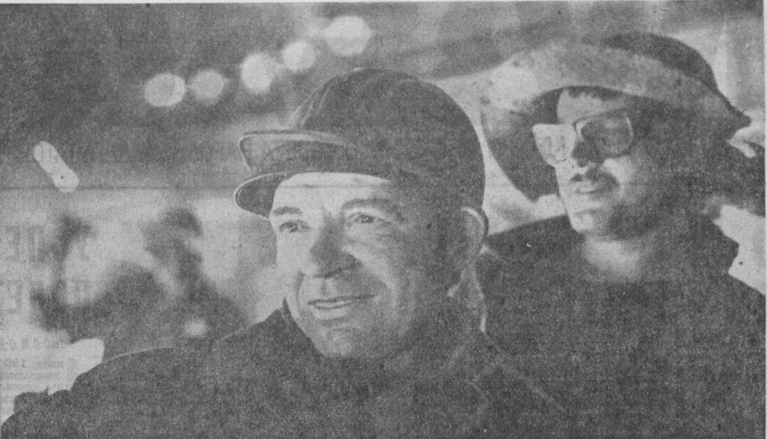
Коллектив Кузнецкого металлургического комбината известен в нашей стране богатими трудовыми традициями. На этом предприятии не раз рождались ценные инициативы и починки...