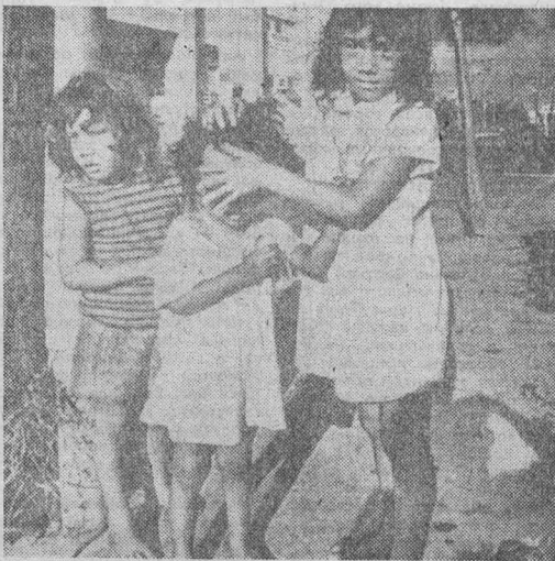
НА СНИМКЕ: эти малыши — свидетели трагедии в Майами.