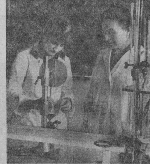
Кемеровский химический техникум им. Ленинского комсомола — одно из старейших учебных заведений Кузбасса и Сибири. В этом году его коллектив достойно встречает 50-летие основания техникума.