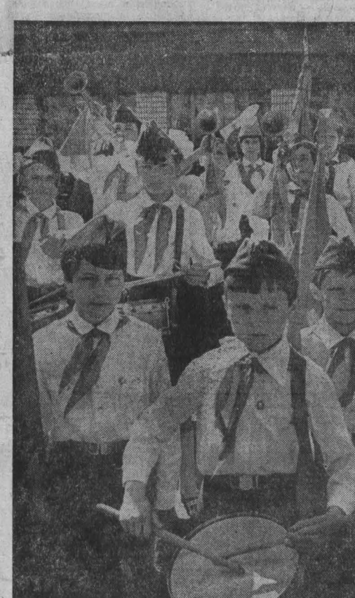
Рассказ о делах кузбасской пионерии читайте на четвертой странице.