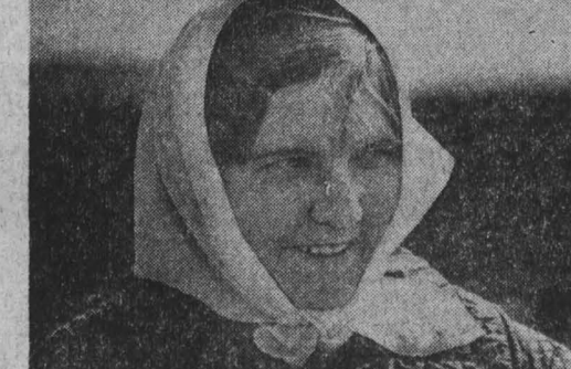
Фото Ю. Сергеева. Кемеровский район.

С утра дело спорилось — техника работала как часы. Еще задолго до обеда агрегат коммуниста А. В. Хаймина засеял сорти гектаров поля. Это почти дневное задание.