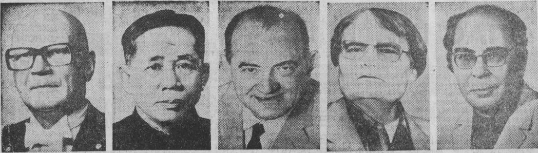
Урхо Калеве Кекконен Ле Зуан Мигель Отеро-Сильва Эрве Базен Абдурахман аль-Хамиси