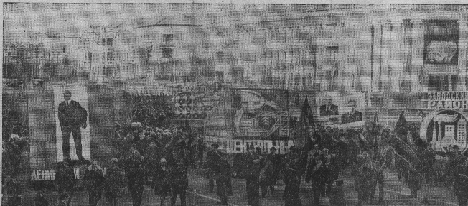
Кемерово. Площадь Советов. Праздничная первомайская демонстрация.

Средства, полученные в результате проведения субботника, будут направлены на строительство санаториев для матери и ребенка, детских дошкольных учреждений и улучшение медицинского обслуживания ветеранов войны и труда.