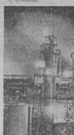
На кемеровском производственном объединении «Азот» готовится к пуску комплекс по переработке природного газа.