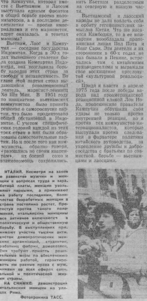
НА СНИМКЕ: демонстрация итальянских женщин на улицах Рима.

ТОКИО, 10 января. (ТАСС). В Японии ширится движение за оказание помощи населению Вьетнама, сильна, страдаяшему из-за наводнений в минувшем году. Сельскохозяйственные труженники Японских островов посвобождают средства для отправки во Вьетнам. Первые партии риса уже отправлены в пострадавшему вьетнамскому населению.