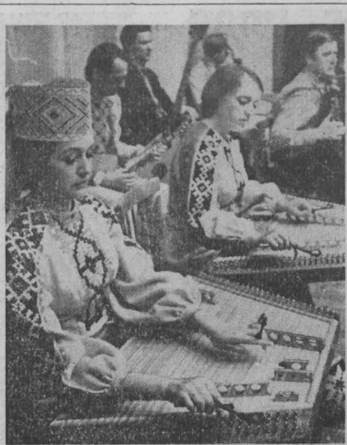
В КЕМЕРОВЕ, Новокузнецке, Междуреченске с большим успехом прошли выступления Государственного народного хора БССР.

В репертуаре хора свыше 300 концертных номеров, на счету несколько тысяч выступлений в городах и селах нашей страны, за рубежом — в Польше, Болгарии, Венгрии, Румынии, Франции, Канаде.