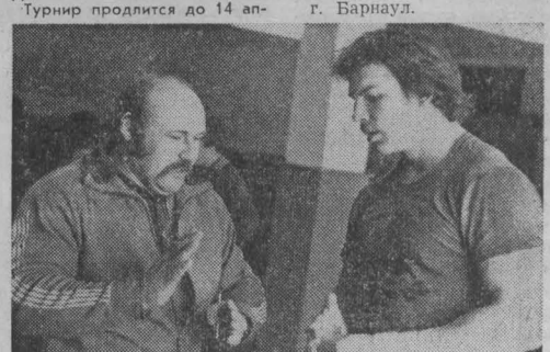
Турнир продлится до 14 апреля.

Занят поканым секретаря и победным стартам и 19-лет-