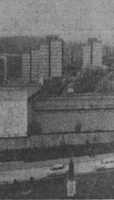
Снимки, присланные нам журналистами города Шагортарьяна, рассказывают о преобразованиях в Ноградской области — побратиме Кузбасса.

Под руководством ВСП трудящиеся Венгрии, выполняя программу построения развитого социалистического общества, добились огромных успехов в развитии народного хозяйства.