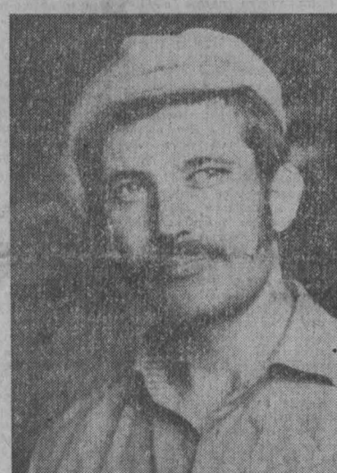
Фото А. Шувалова. Новокузнецкий район.

Немало недостатков и в мясном животноводстве. Колхоз построил новый свинар-