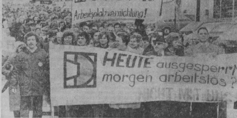
НА СНИМКАХ: участники манифестации в Эссене требуют прекратить ликвидацию рабочих мест.