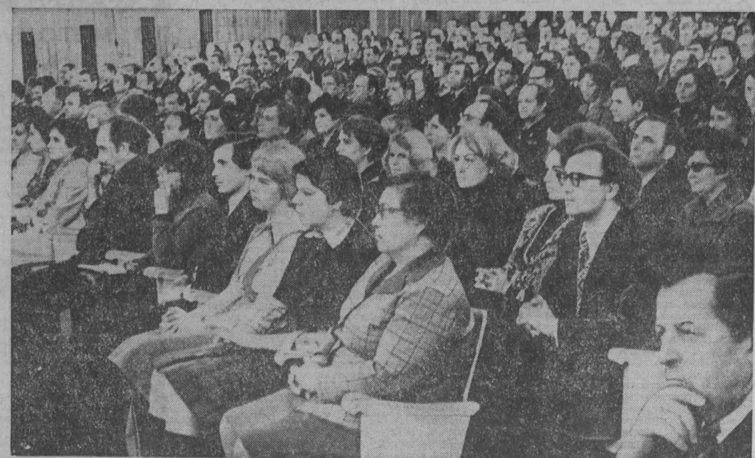
В ЗАЛЕ ТОРЖЕСТВЕННОГО СОБРАНИЯ.

Своим трудовым успехи химиков объединения «Азот» посвящают счастью и миру на земле, что год от года креп союз септа и молота.